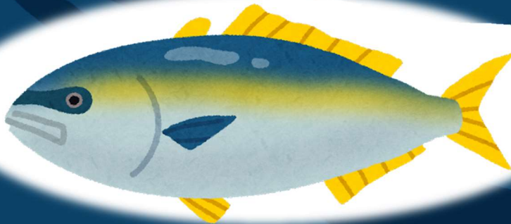
体長 80 センチくらい・・・「ブリ」