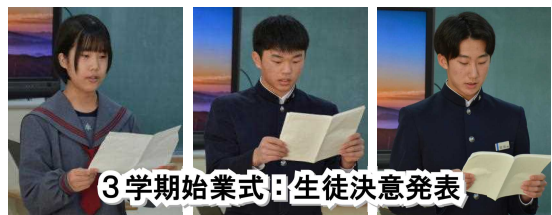
3学期始業式：生徒決意発表