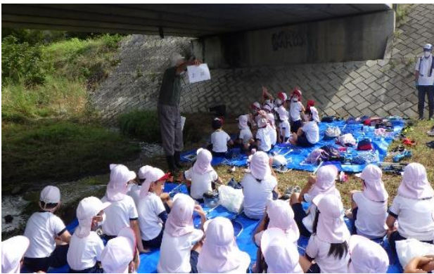
「遊べる水辺づくり推進委員会」の方たちによる 女鳥羽川観察会