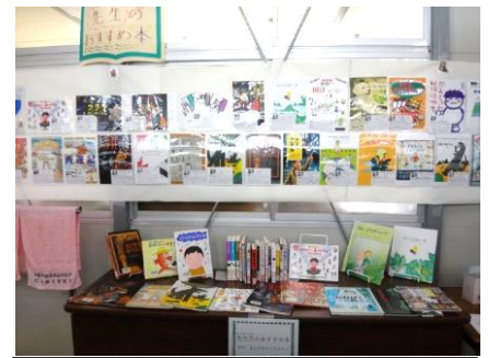
世代差を感じる職員選書です

11月21日～12月2日まで、読書旬間がありました。じっくり本と向き合う機会をつくり、本と触れ合うことの楽しさを味わう時間です。給食メニューに係る本の展示やスタンプカードなどの企画も行いました。先生方も一人一人「おすすめの本」を紹介しました。40冊近く図書館前に並べられ、図書の日や休み時間に足を止めて、興味津々に見つめる子どもの姿が多く見られました。1年生や希望者による仲間への本の紹介、図書委員会の読み聞かせなどもありました。何冊借りてくれたのでしょうか。最近は電子書籍が増えていますが、アナログに本を通して想像や妄想を膨らめたり読みふけったりする機会も大切にしたいですね。