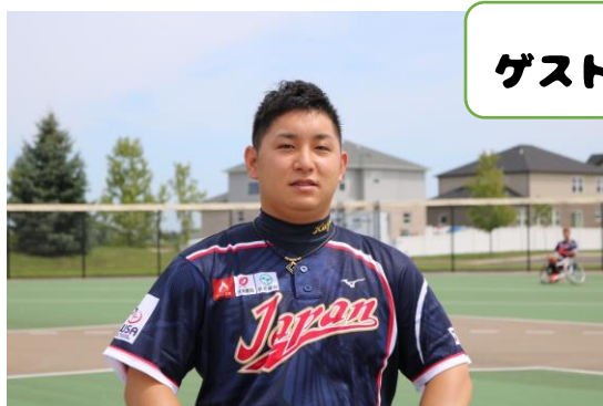
大谷 颯(群馬県) 2022年ワールドシリーズでも、優勝に貢献