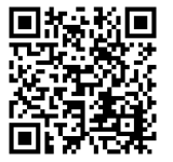
親守詩Youtubeチャンネル