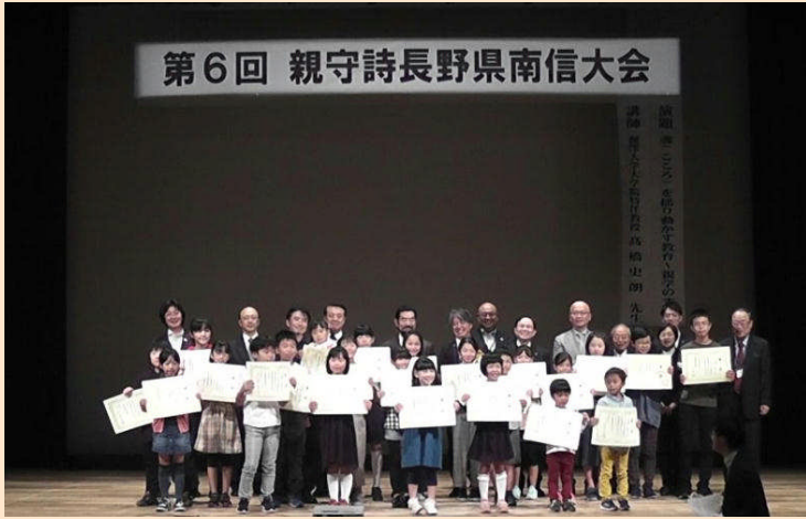
第6回 親守詩長野県南信大会

親守詩とは、子供が5・7・5で、親が7・7で、「感謝」と「親心」を表現する、親子の“キャッチボール短歌”です。