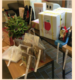
副賞一例(第5回大会)

昨年に続き、コロナウィルスの感染拡大防止のため、表彰式は行わず、受賞された皆様へは学校に表彰状及び副賞をお届けし、各学校での対応にお任せする形をとらせていただきます。