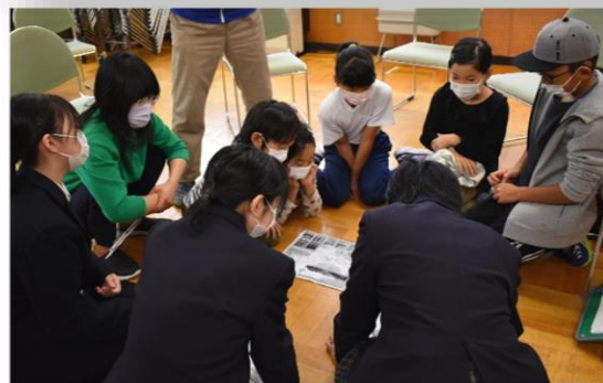
事前説明会の様子。中学生の用意した地図を見て、みんなでコースの確認をする。