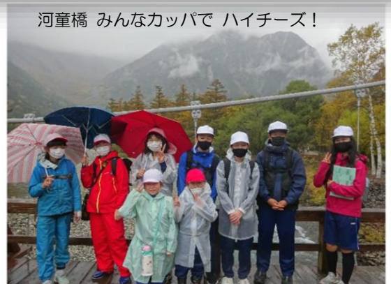
河童橋 みんなカッパで ハイチーズ！