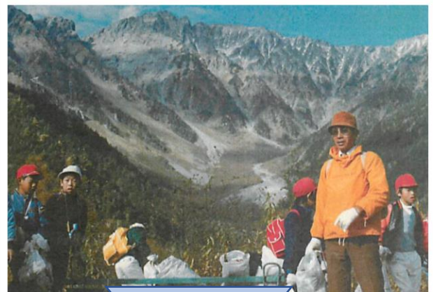
岳沢カールをバックに。昭和のゴミの多さにびっくり！