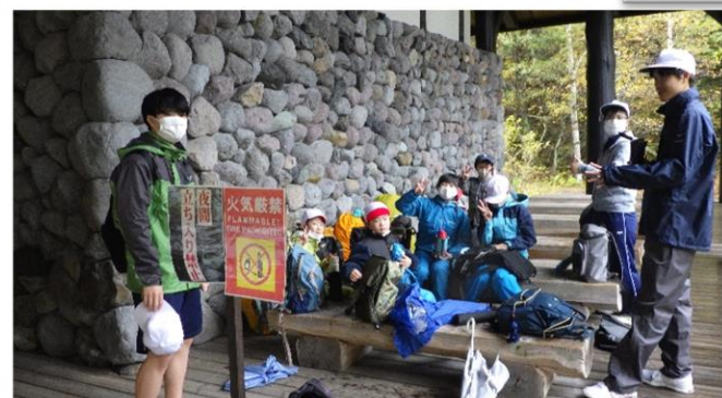
無事にインフォメーションセンターに着。お疲れ様。