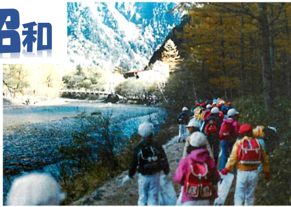
河童橋下流の左岸より。上は三代目の橋