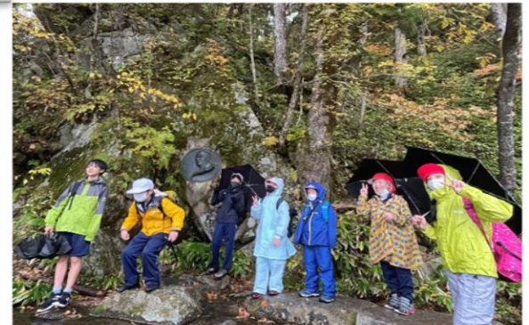
ウエストンレリーフの前で。みんな元気！