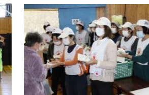
出演者の皆さん、裏方の皆さん、たいへんご苦労様でした