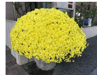
玄関先で迎えてくれます

生きてきた年数に応じて時の流れは速く感じるようになるらしいのですが、コロナでオロオロしているうちに12月を迎えました。外ではマスク着用不要と国は言いますが、ほとんどの人がマスク着用。第8波の現状からすれば当然のことでしょう。そんな時代もあったねと、と歌の文句のように、このマスク時代を振り返る日はいつ来るのでしょうか。