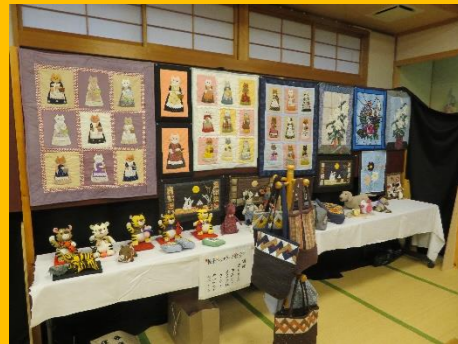
棚峯パッチワーク：「パッチワーク」