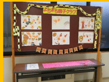
よちよち親子クラブ：「工作」書