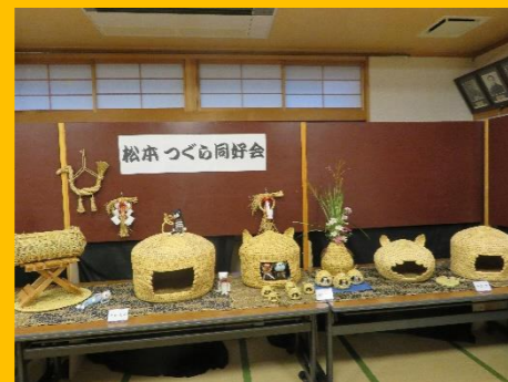
松本つぐら同好会：「猫つぐら」