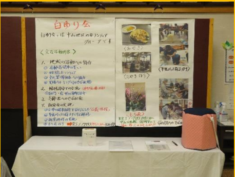
白ゆり会：「活動報告」、「牛乳パック椅子」