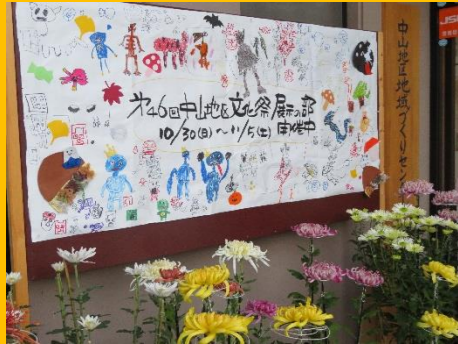
児童センターの児童の絵と今年も美しい菊

前年に引き続き公民館で展示部門を行いました。コロナを吹き飛ばすほどの公民館を彩る、見ごたえのある作品のいくつかを誌面でご紹介します。