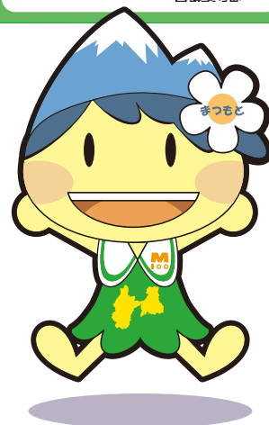
松本市マスコットキャラクター「アルプちゃん」