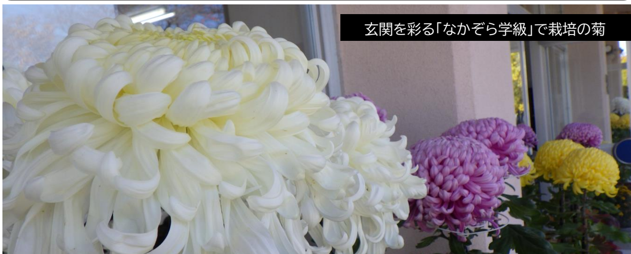
玄関を彩る「なかぞら学級」で栽培の菊

なかよし旬間 今月は、一人ひとりを認め合い、人権感覚を高める学習と活動を行っています。