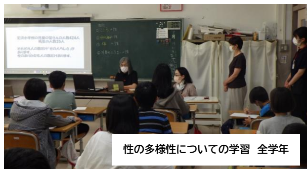
性の多様性についての学習 全学年