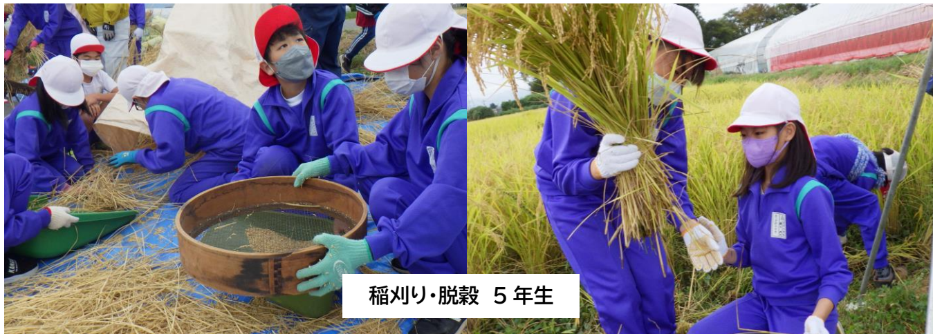
稲刈り・脱穀 5年生