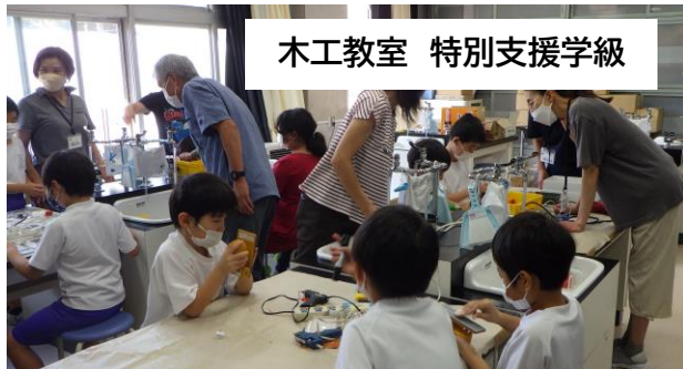
木工教室 特別支援学級