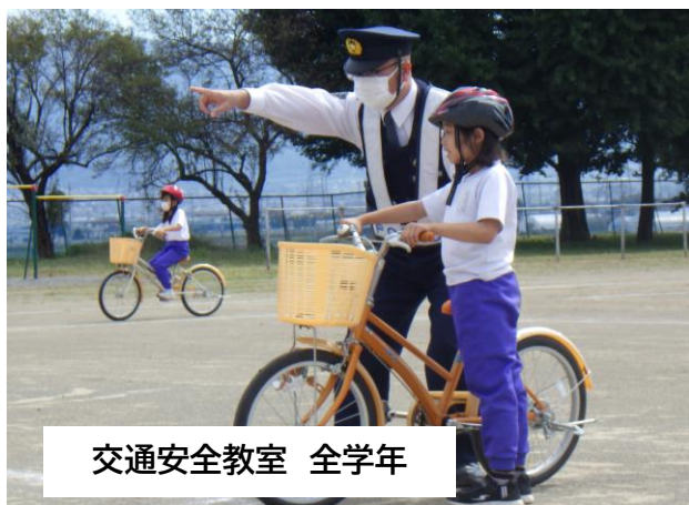
交通安全教室 全学年