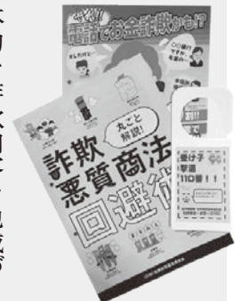
グッズも活用しよう