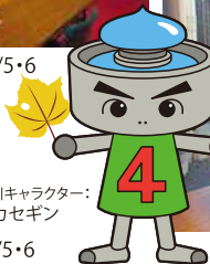
芳川キャラクター： シカセギン