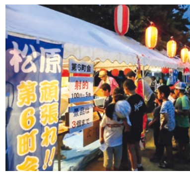
模擬店を楽しむ「いづら祭」

て「いづら祭」を毎年7月に開催しています。住民が工夫を凝らした模擬店を出店し、食べ物や小物を販売します。中学生が準備や模擬店の販売、放送係の手伝いをしてくれるなど、老若男女が集う機会となりました。