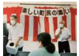
【平田】楽しい町民の集い 9/10