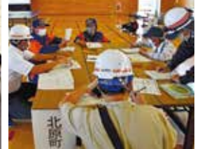
芳川地区総合防災訓練