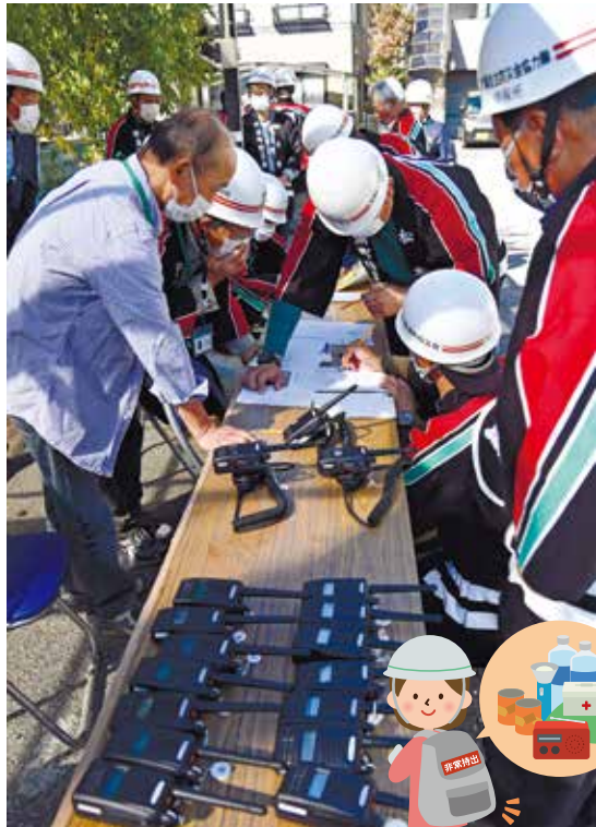
【野溝】町会防災訓練

10月1日、地区・町会で防災訓練が行われました。それぞれで安否確認や給水体験、避難所運営ゲームなどを行いました。災害時は、住民同士の協力が必要不可欠です。訓練で学び、有事の際に備えましょう。