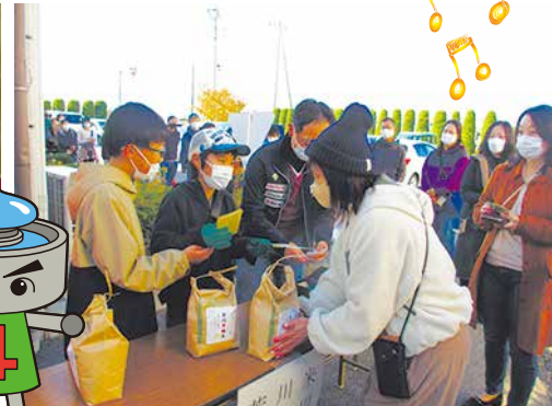
芳川地区活動発表会10/31~11/5