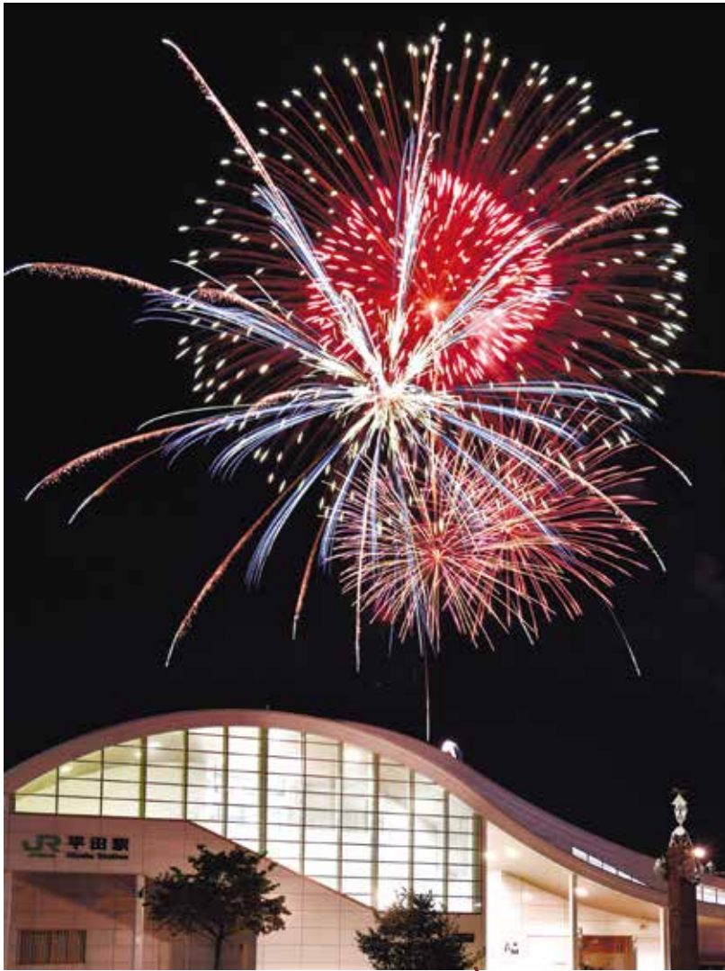
【平田】平田神社例大祭花火9/10

各町会で秋まつりや文化祭が開かれました。 また、芳川地区の文化祭は形を変えて、 活動発表会を開催しました。(間に合ったものを掲載しています)