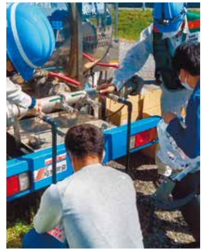
【平田】町会給水車体験