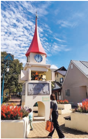
秋晴れのからくり時計

地区の中心に松原モールがあります。モールの中核部には「からくり仕掛けの時計台」が立ち、松原地区の宝として住民を見守っています。