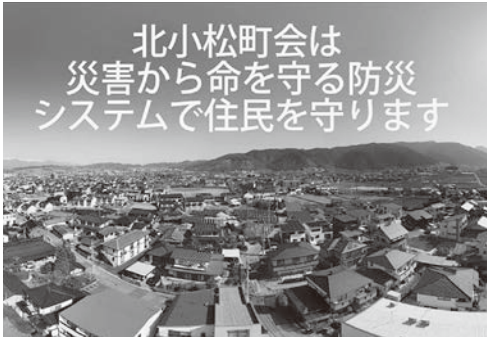
北小松町会ホームページ 動画が流れます

松本大学防災研究所や、シバー人材センターのシニアパソコン教室とも連携して、災害から命を守る隣組単位のきめ細かな防災システムづくりを計画しました。