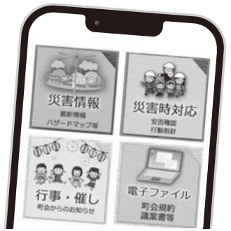
分かりやすいスマホ画面

を掲示し、災害時には気象・河川・県の防災情報などが取得出来る体制を作りました。公民館にはWi-Fiを設置しました。