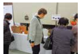
芳川地区活動発表会 10/31~11/5