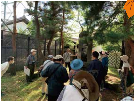
【村井町】文化祭プレ企画・若山牧水と喜志子が歩いた道10/10