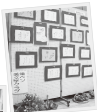
筆ペン美文字クラブ

に加え、2年ぶりに食品販売を実施しました。販売・飲食スペースとなった駐車場は、お団子やパン、クッキーなどを楽しむ人で賑わいました。