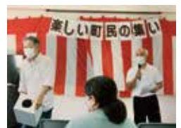
【平田】楽しい町民の集い 9/10