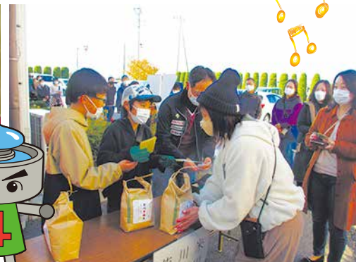
芳川地区活動発表会10/31~11/5