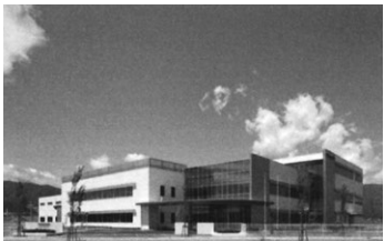
来年で竣工10周年を迎える松本工場

更に加増したため、2013年(平成25年)7月、和地区に拠点を集約、テスコム電機 松本工場として稼働