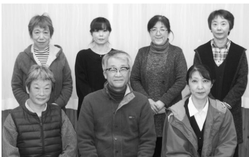
館報編集委員の皆さん 読みやすい館報をめざしています。

そういえば、子供の頃紅葉した柿の葉でひな人形を作ったことを思い出しました。紅葉した柿の葉は色とりどりで、一枚で顔と体を作り、他の葉を十二単のように何枚も重ね合わせて作りました。微妙な色合いが本当に着物みたいできれいだっただけを覚えて