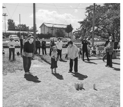
ニュースポーツ「モルック」を体験

名位参加されるのかな?顔 見知りの方が居るかな?と 思いを巡らせ自転車を走ら せました。会場に到着する と『久しぶりー、元気にし てたー?』とあちらこちら で会話が弾んでいました。 会場中沢山の笑顔!笑顔! 良いねー。保育園の子 供さんから人生の大先輩ま で多数参加、開催宣言・競 技説明・準備体操の後、11 チームに分かれ、16ホール のプレイがスタート、始ま るやいなや『ホールインワ ン!』と大きな声、同時に 『わー!』と歓声が秋晴れ の下に響き渡りました。参 加された皆さんそれぞれ楽 しいラウンドができた事と 思います。 3年ぶりの和田のスポー ツ大会、やっぱり良いもの ですね。感謝。 和田町 窪田