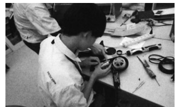
インターンシップ受入の様子

また地域活動として、学生のインターンシップの受入れを積極的にを行っています。単純に仕事を体験するだけでなく、コミュニケーションやチームワーク