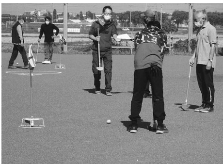
澄みきった青空の下でプレーに集中

ドーン!ドーン!『和田 の皆さん、運動会が始ま りますよー全員集合!』の 合図である花火が、晴天の 秋空に鳴り響く事は今年も ありませんでした。しかし、 今年は新しい試みである和 田地区グランドゴルフ大会 が開催される事になりました。 10月16日(日)の早朝、 心の中で花火を打ちあげ、 開催場所である和田運動広 場にいざ出発!今日は、何