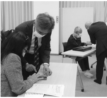
講師の説明を熱心に受ける受講生

参加者は私を含め皆何十年か前の若者でした。持ち運びの簡単なスマホ、上手に活用して、また続く人生、今より楽しいものにしていただけたらなあと思いました。