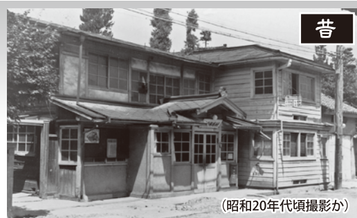
(昭和20年代頃撮影か)

昔 村井郵便取扱所として明治7年1月12日に創立し、明治19年4月1日村井町郵便局と改称。また明治39年1月1日村井郵便局と改称する。昭和50年3月1日松本南郵便局と改称し、昭和56年に平田に移転する。 郵便業務の他に大正9年5月1日から電話交換事務も取扱っていた。