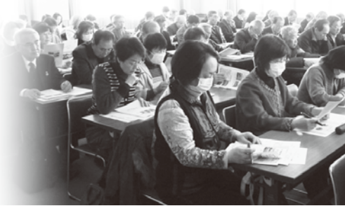
▲参加者全員に詳しい資料が配られるなど実りある地域づくり

づくりを推進し、お互い助け合い、学び合い、安心して暮らせる持続可能な地域社会を目指すとの話がありました。