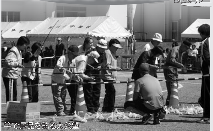
竿で景品を釣る太公望