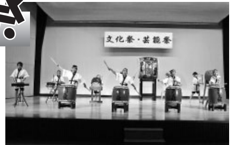
子どもたちの屋形太鼓（芸能祭）