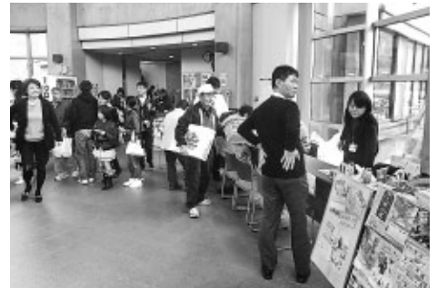
あいにくの天気でしたが、たくさんの方にご来場いただきました