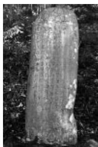
石碑 『勝山巖翁顕彰碑』

7年程、相棒として尽くしてくれた体重計がついに悲鳴をあげた。これ以上の重労働はとりタイアさせてやり、お手頃価格な新しい相棒を購入。電池を入れ、初期設定を済ませていざ乗ってみると、示された体重の値よりも、あったことすら知らなかった機能