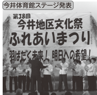
「コールフレンド今井」の皆さん