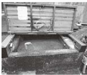
▲ みつつ目の蓋つき井戸