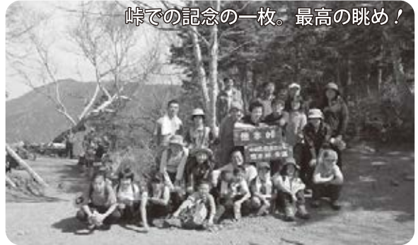
峠での記念の一枚。最高の眺め！