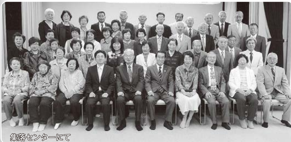
集落センターにて