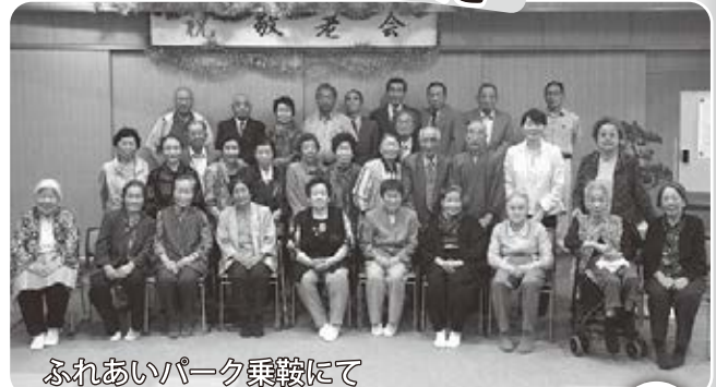
ふれあいパーク乗鞍にて