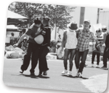
「二人仲良く」 風船を割るんだって 根性ある風船でなかなか割れなかった