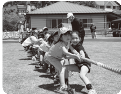
綱が切れそうなくらい頑張って引きました