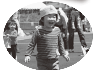
1着ゴール 「おみやげ」忘れてるよ～