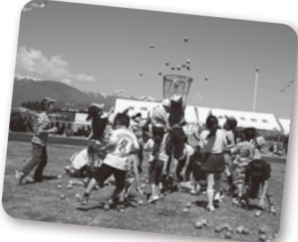
カゴに嫌われてなかなか入らない「玉入れ」