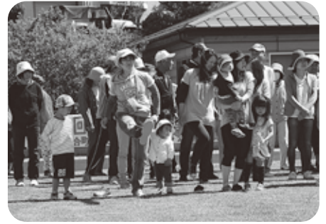
天までとどけ(スリッパ飛ばし) 目の前に景品がチラツキなぜかスリッパは天高く