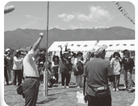
「休憩時間」 朝どりレタスのジャンケン大会 校長先生に勝たないとだめだよ