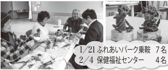
1/21 ふれあいパーク乗鞍 7名 2/4 保健福祉センター 4名

まつぼっくりや木の実など身近な山の素材を使ってのアースアート。恒例となりました干支シリーズは今年で6回目です。