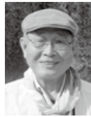
遊歩道整備推進委員会 浅間温泉遊歩道木の絆会

新春を寿ぎ謹んでお慶びを申し上げます。大音寺山から御殿山につながる東山一帯は、急峻にして宏かつ幽邃、溪流と眺望に恵まれた里山であります。そこに人力が加わり、春は桜・ツツジ、夏はサルスベリ・溪流絶景、秋はモミジ・ドウダンツツジの紅葉、菊花の乱舞、冬は北アルプスの雪景色、四季を通して楽しめる魅力ある里山、まさに「浅間温泉の宝の山」へと変貌しつつあります。