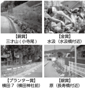
【銅賞】三才山(小寺尾)