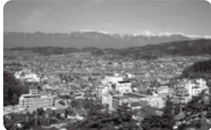
【大音寺山からの眺望】