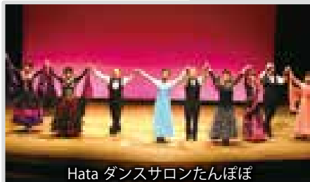
Hata ダンスサロンたんぽぽ

文化センター会場では、24日(土)アクトホールにて文化祭開会式が開催されました。 実行委員長の挨拶に続き、公民館、体育館、文化センター各会場の展示や催し物が紹介され、安留風寿太鼓や、波田少年少女合唱団による特別演奏が式に花を添えました。