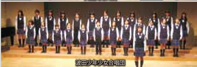
波田少年少女合唱団

文化センター会場では、24日(土)アクトホールにて文化祭開会式が開催されました。 実行委員長の挨拶に続き、公民館、体育館、文化センター各会場の展示や催し物が紹介され、安留風寿太鼓や、波田少年少女合唱団による特別演奏が式に花を添えました。