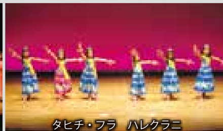
タヒチ・フラ ハレクラニ