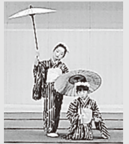
大人顔負けの演舞

10月31日と11月1日、奈川地区文化祭が行われました。 様々な展示物、農産物が並び、公民館講座「押し花アート講習会」「プリザーブドフラワー講座」の力作が文字通り華を添えました。今年タイムカプセル開封式が行われ、奈川村閉村時に埋設された記念物品が10年ぶりに開封されました。大勢の関係者に見守られながら次々とお披露目された。