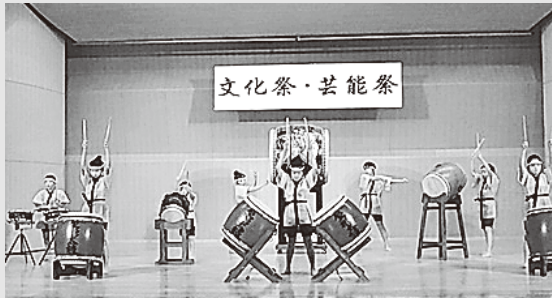
公民館講座「屋形太鼓」を披露する子どもたち

10月31日と11月1日、奈川地区文化祭が行われました。 様々な展示物、農産物が並び、公民館講座「押し花アート講習会」「プリザーブドフラワー講座」の力作が文字通り華を添えました。今年タイムカプセル開封式が行われ、奈川村閉村時に埋設された記念物品が10年ぶりに開封されました。大勢の関係者に見守られながら次々とお披露目された。