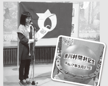
タイムカプセル開封式の様子

品々。皆さん一様に懐かしさがこみあげた事でしょう。芸能祭では慣れた舞台とあってか、リラックスとして練習の成果を発表するグループが、それぞれの色を出しながら美しい音色や踊りを見せていました。