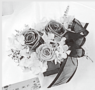
プリザーブドフラワー作品

品々。皆さん一様に懐かしさがこみあげた事でしょう。芸能祭では慣れた舞台とあってか、リラックスとして練習の成果を発表するグループが、それぞれの色を出しながら美しい音色や踊りを見せていました。