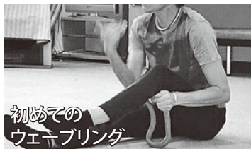
初めてのウェーブリング