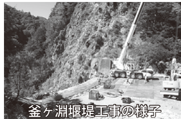
釜ヶ淵堰堤工事の様子

9月29日に、梓川流域砂防施設の見学が行われました。最初に向かったのは金原砂防堰堤です。間近に見る堰堤は大きく立派なもので迫力があり、河川左岸に造られた魚道には、悠々と泳ぐ魚の姿が見られました。上高地にほど近い釜ヶ淵上流砂防堰堤では一般の立ち入りができない所を案内していただき、足のすくむような高さから下方に見える大規模な堰堤修復の現場の様子を見学しました。