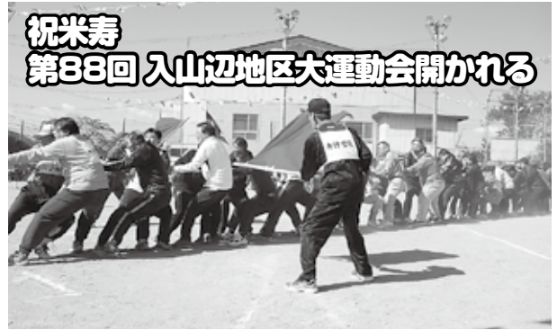
祝米寿 第88回 入山辺地区大運動会開かれる

晴天の10月18日、人生でい えば米寿を迎える入山辺地区 大運動会が、多くの住民の参 加の中、盛大に開催されまし た。 今年の特徴は、昨年まで行 われてきた採点種目の夫婦ト ンネルが、選手の選出が困難 なチームがある等から取り やめられ、代わりに買い物リ レーが取り入れられました。 また、全員が参加できる、お 楽しみ抽選会が工夫され、最 後まで楽しめる企画となりま した。 大正の時代から戦争を挟み ながらも入山辺住民の一大イ ベントとしての大運動会が平 成の時代を迎えて開催され