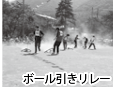
ポール引きリレー

けてきたとのこと。今現在とは違う大変な中、 脈々とタスキを渡し続けた先 人がいたからこそ、今日、米 寿を迎えることができたので はないでしょうか。大会長も あいさつの中で「次は100 歳まで」とありましたが、決 して夢物語ではない気がしま す。100歳の運動会はどの ような光景が展開されるので しょうか。みなさん想像して みてください。 (館報編集委員長 朝倉康直)