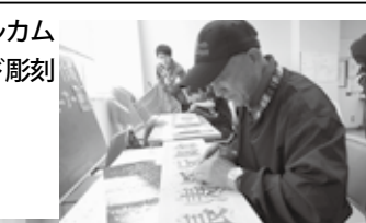
ウェルカム ボード彫刻

毎年恒例の無料コーナーも 好評で、とん汁やおにぎりは もちろん、わたあめは大人も 子どもも嬉しそうに並んで いました。こんな山辺にする じゃんごと男の健康料理教室 で作るそばクッキーもあつと いう間に終了しました。 そして、JA入山辺支所収