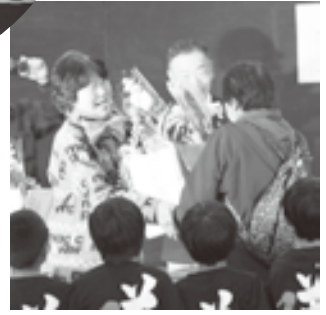
▲抽選会も開催されました。

体育館入口にはテーマ「よりあうよりそう芳川」にちなみ園児から小学生、町会長の方々の手形の輪の展示、また今年は消防団の方にも参加していただき、消防車の展示や消防用防火服の試着講演として芳川小学校4年1組による人形劇で、会場をおおいに盛り上げていただきました。