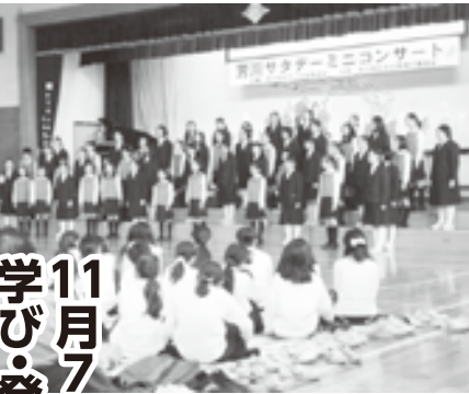
▲芳川小児童・筑摩野中生徒による合同合唱

展示、体験コーナー、ステージ発表、ミニコンサート、劇団であい舎による劇団公演、芳川小学校5年生による「芳川華米(ほうせんかまい)」の販売など、今年も盛りだくさんの出し物でにぎわいました。