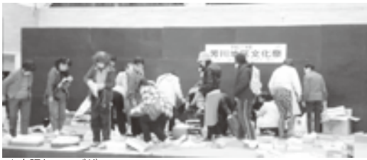
▲大賑わいのバザー