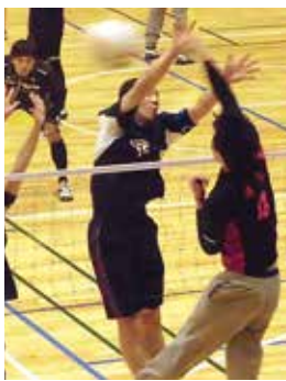
ソフトバレー・熱戦の様子