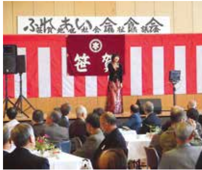
熱唱に聴き入る皆さん

秋のふれあい会食会が10月17日(土)に笹賀公民館多目的ホールで行われました。趣旨は「地区社会福祉活動の一環として、高齢者が楽しい雰囲気の中で、地域との交流を深め、食を通じて健康を学び、お互いの顔を見ながら情報交換をする場」です。参加者は65才以上の一人暮らし、75才以上の二人暮らしの方を対象としたもので、今回は74名の方にご参加いただきました。