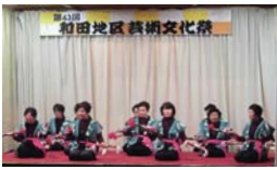
いなほの会 (銭太鼓)

11月1日(日)、穏やかな小春日和の中、第43回和田地区芸術文化祭が開催されました。 大会議室では、12の団体によるステージ発表がありました。