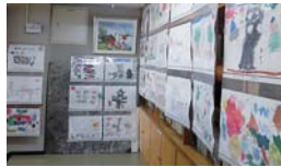
和田保育園児の絵