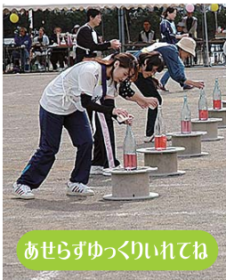
あせらずゆっくりいれてね