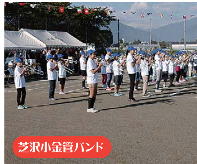
芝沢小金管バンド