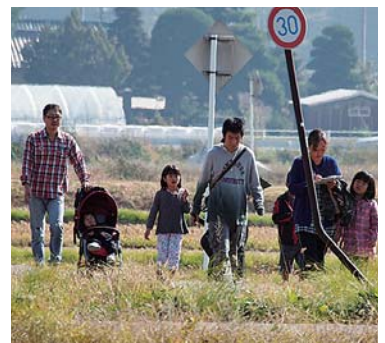
老若男女が連れ立って