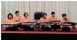
衣外たんぽぽ会 (大正琴)