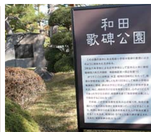
新しくなった歌碑公園の名称板

○和田公民館の隣の歌碑公園にある「公園名称板」および歌碑・句碑にある短歌や俳句を読みやすく記した看板が新しくなりました。