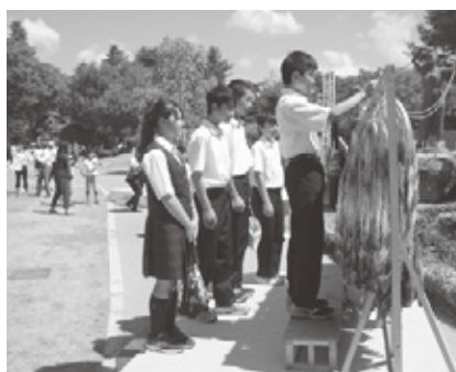
▲ あがたの森公園にて。祈りを込めて...

戦後 70 年を迎える節目の式典。先に広島を訪ねた中学生の代表者の話にも耳を傾け、安曇・大野川校の児童・生徒が平和への願いを込めて折った折り鶴を、両校の代表者が献上しました。