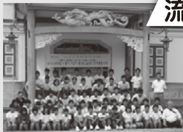
▲ 旧開智学校前で撮影