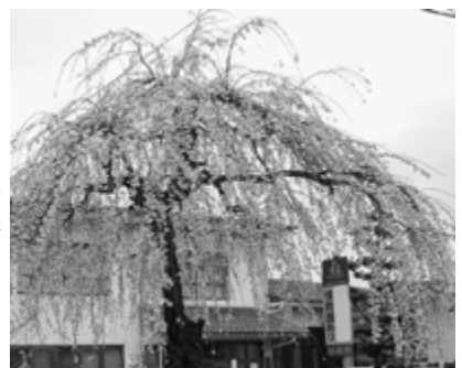
公民館のしだれ桜

そして、出張所の地域振興、公民館の学習、福祉ひろばの地域福祉の機能を、一体的に連携させ、地域の最前線で、