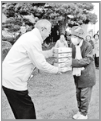
最初に行われた表彰式