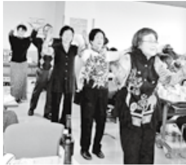
みんなで楽しく踊りましょー!!

地元町会のお付き合いは多少あるとはいえ、転勤族の我が家にとつて周りのほとんどは知らない顔ぶれ。しかも子連れの出席で少し不安でしたが、多くの方に気さくに声をかけてもらい、手作りの料理もいただきなどとても楽しい時間を過ごすことができました。 ぜひ来年は青空の下、満開の桜を皆さんと見たいと思います。日ごろ地域内の交流があまりない方も、是非参加してはいかがでしょうか。