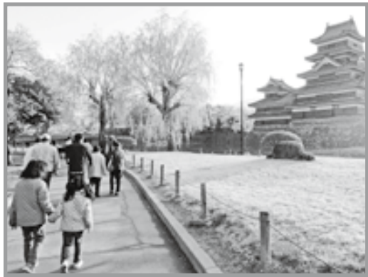
早朝の松本城を眺めながら