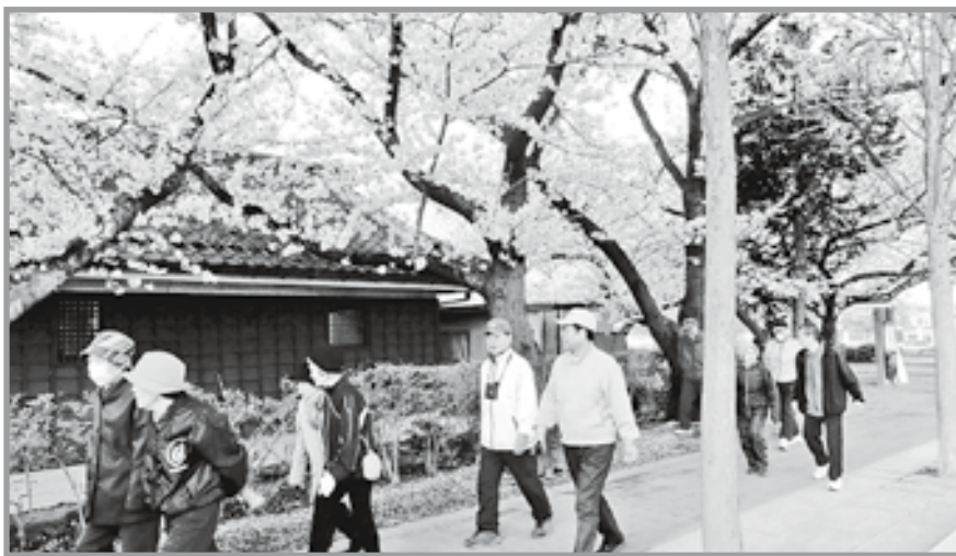
桜も満開で会話が弾みます

毎年4月から10月の第2日曜日の朝6時から行われている中央地区町内公民館長会主催の「歩こう会」が4月12日(日)にスタートしました。 当日は桜満開の中、博物館前に集まり、昨年度の「皆勤賞」4名、「精勤賞」6名の表彰が行われました。 簡単な準備体操の後、早朝の清々しい空気の中、松本城