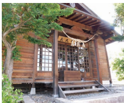
加助の悲哀、貞享義民塚