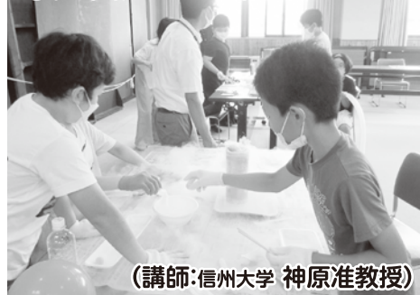
(講師:信州大学 神原准教授)