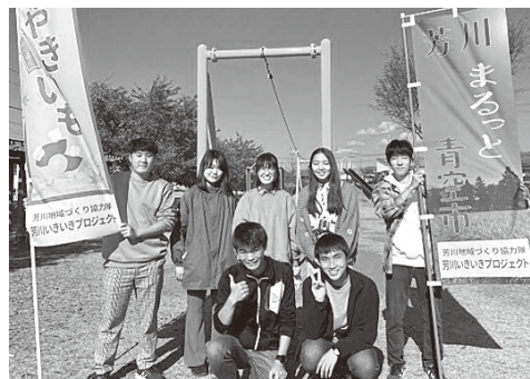
昨年の青空市の企画運営をした学生たち

気軽に参加した活動から、地域の課題を考えるようになってきました。このプロジェクトの効果は重要と言えます。未だの松本を支えていく若者たちには、地域の課題を知るために、参加しやすい活動の機会を作ることが必要です。