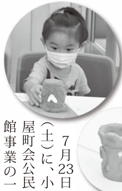
館事業の一環として、毎年行っている教養講座(寺子屋塾)でラントン作りを第二公民館で行いました。

市立考古博物館の職員を講師に迎え、3組の親子8人が参加し、世界に一つだけのマイラントンができました。七色に光るランプが入った紙コップの周りに、紙粘土で工夫を凝らして飾りつけをし、土器やはにわの形に仕上げました。親子でつくった夏休みの良い思い出になりました。