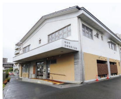
場所を移転した白板公民館

平成26年12月、白板・波田・本郷の3地区が地域テキストのモデル地区となりました。