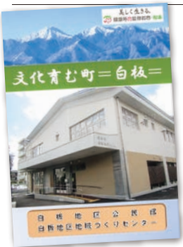
モデル事業・地域テキスト

折も折、翌年の白板公民館新館開館に間に合わせようと編集委員会を組織し、8カ月足らずで白板地区の歴史や町会・公民館活動・各種団体・施設などを記載した地域テキストが完成しました。約300部作成されたテキストは、地区内の小中学校などに配布され、活用されています。