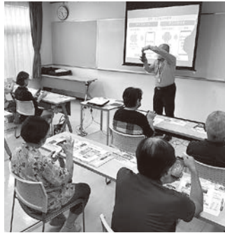
スクリーンも活用して分かりやすく