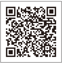
閲覧できる公民館報と二次元コード