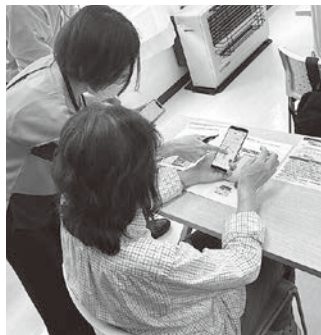
個別の相談にも対応

参加者の感想は、「次回も受けたい」「もっと勉強したい」「いろいろな用途に使ってみたい」など、これからの利用拡大を予感させるものがありました。