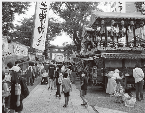
〈舞台の復活で賑わう境内 2022.7.25 撮影〉

25日の夕刻には、町内に舞台庫がある本町5丁目の舞台はお囃子の音とともに街中をえい行しました。深志神社の創建は古く、江戸時代にはお城と城下町の総鎮守として歴代城主からも敬われました。「天神祭り」は城主小笠原忠真が南深志の町内に舞台を造らせたことから始まる(1615年)と伝えられます。町人の心意気を競いあつて制作してきた舞台は、信州一の商都松本の繁栄の象徴でもあります。