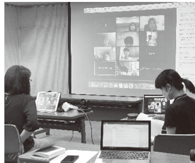
ZOOMを用いたハイブリットな会議

これまでに、青空市、地域住民が災害の時にも役立てられる家族紹介カードづくり、小学生向けの『eスポーツ』体験会が実施されました。2カ月に一回開かれる会議では、遠方の学生や、電車の中から参加した学生もいました。発言しやすい空気があり、積極的な意見交換がされました。