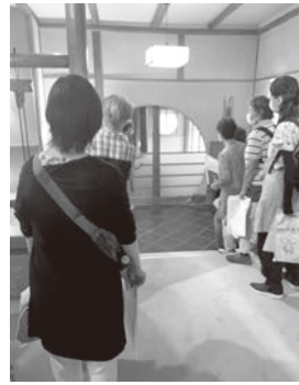
笹屋ホテル豊年虫

8月27日(土) 公民館文化委員会主催で、通算3回目の重要伝統的建造物群保存地区の視察を実施しました。今回は地元ボランティアガイド、楽知会さんの案内で稲荷山地区の商家の街並みと長雲寺、戸倉上山田温泉の温