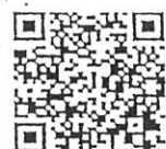
メールアドレスQRコード →