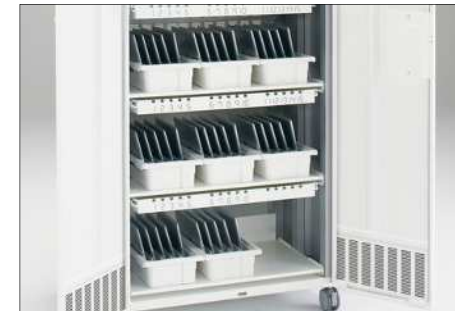
扉を開いたところ