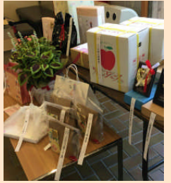
副賞一例(第5回大会)

昨年に続き、コロナウィルスの感染拡大防止のため、表彰式は行わず、受賞された皆様へは学校に表彰状及び副賞をお届けし、各学校での対応にお任せする形をとらせていただきます。