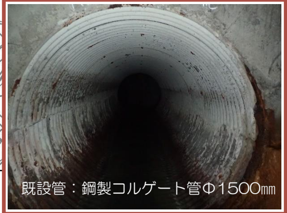
既設管：鋼製コルゲート管Φ1500mm