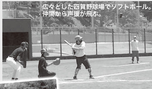
広々とした四賀野球場でソフトボール。仲間から声援が飛ぶ。

5月29日(日)、野外で行うマレットゴルフ、ソフトボール、ゲートボールの3球技に絞り、地区大会が開催されました。当日は初夏らしいさわやかな晴天のもと、久しぶりに会う仲間たちとごやかに会話しながらのびのびと競技を楽しみました。