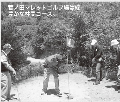
菅ノ田マレットゴルフ場は緑豊かな林間コース。