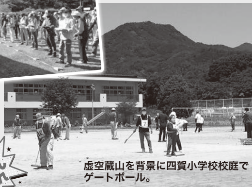
虚空蔵山を背景に四賀小学校校庭でゲートボール。