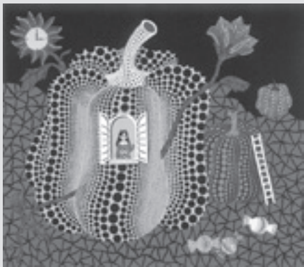
草間彌生《こんにちは》1989年 シルクスクリーン ©YAYOI KUSAMA