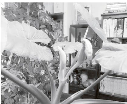
クワズイモに花が咲いた

葉の形が里芋、芋が海老芋に良く似た有毒な植物、観葉植物として葉を楽しみます。サトイモ科クワズイモ属の多年草。原産地は熱帯アジア