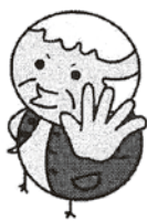
電話でお金詐欺防止キャラクター「ピイじいさん」