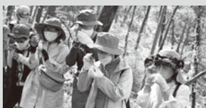
▲ルーベで植物観察する参加者