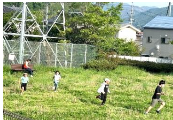
隣の公園で駆け 回りました！