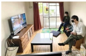
大画面で迫力の 対戦ゲーム！