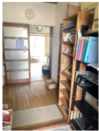
早速くつろいでいます！