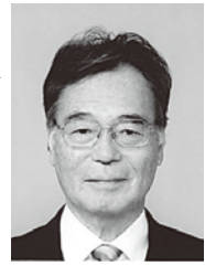
地域の絆！ 町会内の交流が 大切

30分間のストレッチと90分間のエアロビクスで日頃の運動不足がたたり、体中の筋肉が悲鳴をあげている…。今日は松本市熟年体育大学の定例日でした。