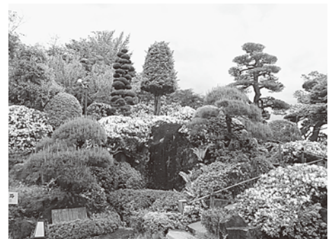
満開のツツジ (桃仙園)