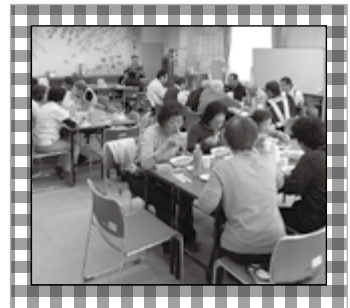
パクパク「男のカレー」(4/14ウォーキング後)

せせらぎで元気に遊んでいる子どもたちを見てみると、保護者、地域の皆様の清水小学校に寄せる思いとともに、伝統の重みを感じます。皆様の本校への期待を真摯に受け止め、学校目標である「心豊かな子ども」「良く考える子どもの具現化を目指し、全職員で誠心誠意努力してまいります。これまで同様、ご理解、ご支援をお願いいたします。