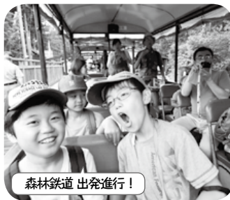
森林鉄道 出発進行！