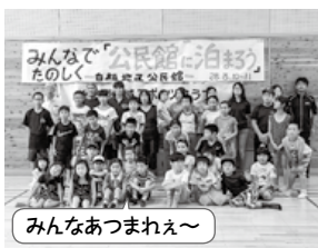
みんなあつまれえ～