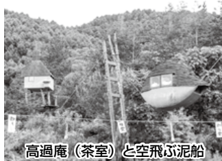
高過庵 (茶室) と空飛ぶ泥船