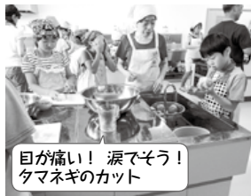
目が痛い！涙でそう！ タマネギのカット

8月10日(水)・11日(木)、白板地区公民館で丸ノ内スポーツクラブ「公民館に泊まろう」を参加者30名で行いました。又、社会教育実習で中央公民館に研修に来ていた大学生2人もスタッフとして参加しました。開会式・スイカ割りの後、3年生以上が夕食づくりを行いました。涙を流しながら玉ねぎを切っている子供たちが多くいました。