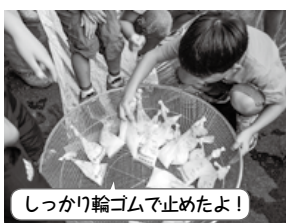
しっかり輪ゴムで止めたよ！

昨夜用意した朝食用ビニール袋の口を輪ゴムで止めてお湯の中に入れ、目玉焼き等の朝食づくりを行いました。みんな、2日間楽しい体験ができたと思います。