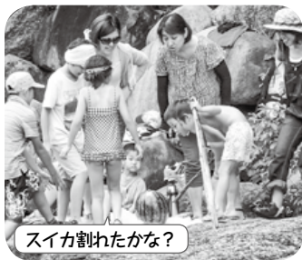
スイカ割れたかな？