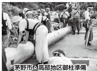
茅野市・高部地区御柱準備