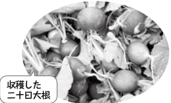
収穫した二十日大根

日赤奉仕団みなさんの指導により、2つの学習をしました。その①タオル3枚で防災頭巾を作