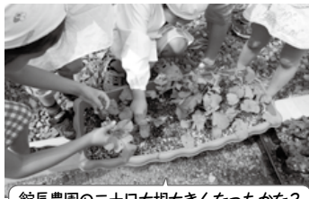
館長農園の二十日大根大きくなったかな？

館長がプランターで育てた二十日大根を1・2年生が、収穫体験をし、夕食のサラダになりました。