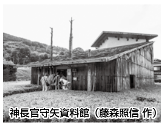
神長官守矢資料館 (藤森照信作)

8月28日(日)に里引き建御柱を行い、地区・集落等まだまだ御柱は続くとのことでした。 思いがけず、小さな御柱に遭遇して、感激しました。