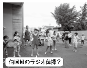
何回目のラジオ体操？