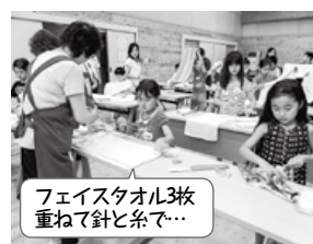
フェイスタオル3枚 重ねて針と糸で...

りました。なれない針と糸に苦戦しながら、全員完成させました。いざという時に役立つと思いますが、そういうときに来ないことを祈ります。その②夕食後、非常炊き出し用のビニール袋に米を入れて非常食づくりの体験をしました。