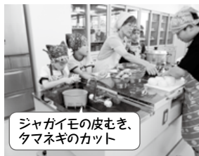
ジャガイモの皮むき、 タマネギのカット

館長がプランターで育てた二十日大根を1・2年生が、収穫体験をし、夕食のサラダになりました。