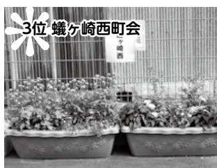
3位 蟻ヶ崎西町町会

8月11日(木)までコンテストを行った結果1位城西町町会、2位宮瀬東町町会、3位蟻ヶ崎西町町会となりました。総投票枚数169票329得点でした。 8月1日の暑い中、寄せ植え作業をされた住民の皆さんご苦労様でした。 コンテストが終了しても、綺麗に咲き続けていますので、ぜひ観賞に訪れてください。