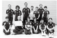
見事優勝!! 卓球代表メンバー

軟式野球及びゲートボールが雨のため中止。卓球、ソフトバレー、マレットゴルフで熱戦。