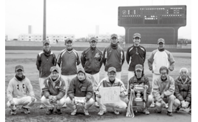
優勝杯奪還!! 軟式野球代表メンバー