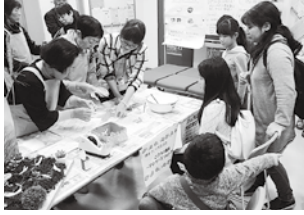
健康づくりブース

大和合神社からそれぞれ3名ずつ、祭の衣装に身を包んだり個性豊かな木遣りの文句で歌い上げていきました。会場からは笑い声も上がるほどの盛り上がりで、三神社の木遣りを一度に聞ける豪華な発表でした。その他、小中学生の演奏や合唱、大人たちによるジャズ・コーラス・民謡・沖繩三線などが発表され、普段見られない子や孫の発表する姿を見て楽しんでる様子も見られました。