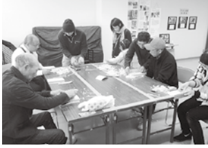
マイ箸づくり体験