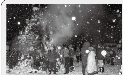
沢渡地区 さわんど温泉湯の郷公園

大野川地区 梓水神社境内 厄年の人による火付けや投銭を行う厄落としの行事で、沢渡では「塞(せい)の神」と呼びます。