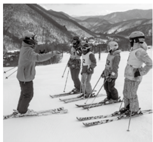
乗鞍高原スキー学校のインストラクターに指導していただきました

2 回目のスキー教室では、スキーを練習しました。この日は、自分では、うまく滑れたかは分からないけれど、連続ターンができるまでにはなったので、うれしかったです。これからも、スノーボードを練習していきたいなと思います。