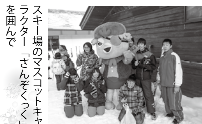
スキー場のマスコットキャラクター「さんぞくっく」を囲んで

ただけなので、ものすごい技ができたりはしなかったです。最初から全然上達しなかったのは、リフトから降りるときです。ほぼ毎回のよう転んでしまったので、いつかはちゃんと降りられるようになります。といっても来年は無いので自分で上達しなければいけないです。一日を通して最初から最後まで楽しく滑ることができました。そして最初より急斜面でも滑ることができるようになつてうれしかったです。とても楽しい一日でした。