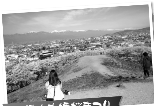
弘法山古墳桜まつり