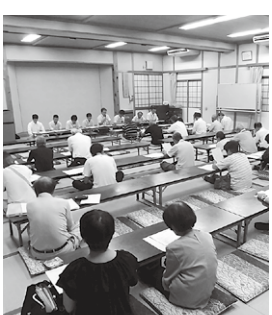
真剣に説明を聴く参加者

なお、5月から3月までの工事期間中、大会議室に事務室が仮設され出張所業務が行われますが、公民館の利用、公民館を会場とする事業はできなくなる見込みです。また、福祉ひろばの西側が仮設通路になるため、部屋が少し狭くなります。敷地内に、現場事務所や工事関係資材などが置かれる見込みで、身障者用駐車場1台分を除き公民館前は駐車ができなくなります。工事期間中は、いろいろな不便が予想されますが、ご協力をお願いします。