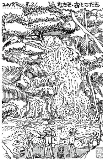
馬籠から妻籠への道中に立ち寄った男滝 (右隣の女滝と吉川英治の小説「宮本武蔵」の舞台となった滝)

「藤村記念館で、しっかりと話をしてくださったので、妻籠宿、脇本陣の方の説明がよく理解できました。島崎家の人々