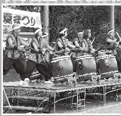
中山太鼓連の和太鼓演奏