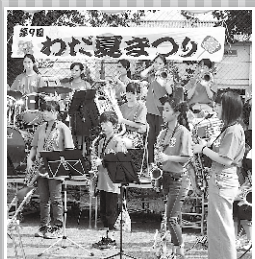
高綱中吹奏楽部の演奏