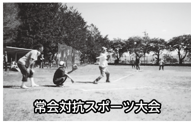
常会対抗スポーツ大会

このうちのスポーツ大会、今年は、6月4日(日)に、東西南北4常会の対抗でトリムバレーボールとソフトボールが行われました。100名余りの住民が参加し、和やかな雰囲気の中で熱戦が繰り広げられました。運動終了後には、慰労会が開催され、親睦を深めるいい機会となりました。常会(こと)に行っている事業・行事としては、毎月1回の常