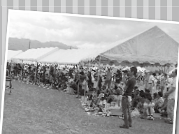
アトラクションに集まった大勢の観客